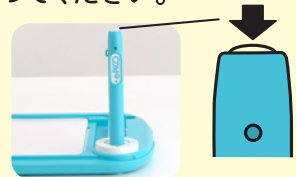
ペントップボタンを押して入力や決定