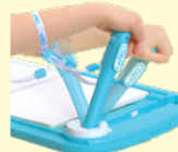
上下左右に傾けて移動

設定アイコンをペンでタッチすると、各種設定を行えます。 絵本ソフトを起動中でも設定を行えます。 画面が切り替わったら、ジョイスティックで操作してください。 ※必ず保護者の方が行ってください。